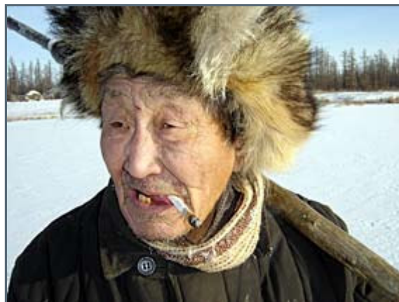
An old yakut man ready to meet the cold!