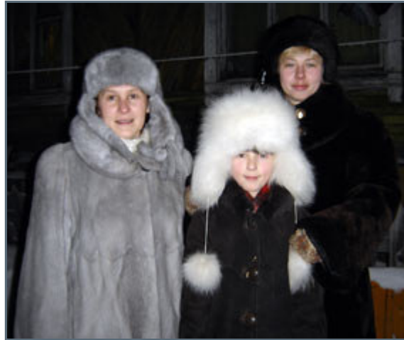
Siberian ladies dressed up to handle winter

This also means that one only has the chance to buy certain things three times a year. For example, when we arrived to Zyryanka a month ago, we did it at the same time as the last boat with food. During our first few days shops were full of luxuries like bananas, vegetables, seafood and sweets. Today, a month later, there's basically only tinned food, Chinese