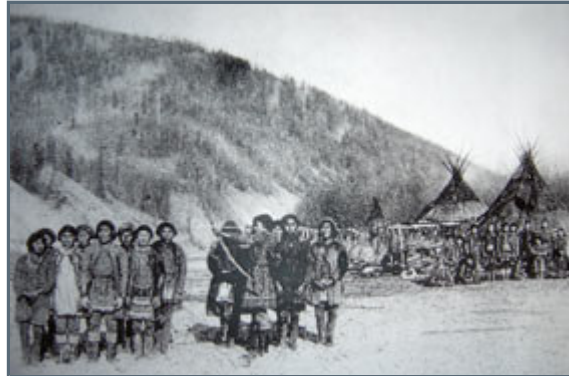
The Kolyma Yughahirs originate from the Korkodon area along the Kolyma River

The majority of yughahirs today live either in Zyryanka or in a small