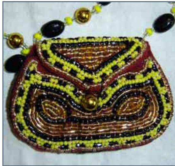
Handicraft work done by Ljuba yugahir-style

"Well, I use the bird wing to wipe bread crumbs of the table. Can't find these things in shops today. And I use the fur to clean the table."