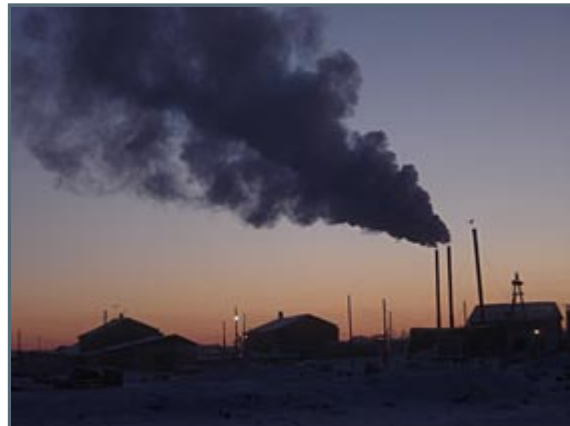
Srednekolymsk at sunset, or sunrise

She quickly stood up and hurried away into the traditional yakut cot called balagan. When we entered the cot, the stove was going at full speed, but the neat and tidy room was still somewhat cold. We than realized that they've probably