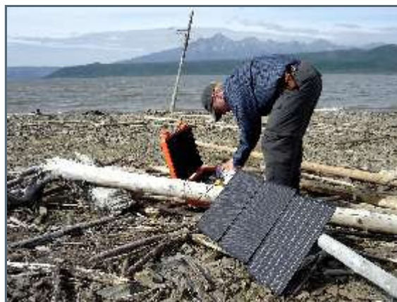
Recharging batteries during our rest day

I beg to differ with a different opinion. One thing is for sure, he hasn't spent one single second a rainy autumn day in the hostile surroundings of the north Siberian taiga! Because, at the exact moment you pull your pants down, a massive black cloud of mosquitoes initiate an extremely itchy and painful attack, taking you to the brink of madness! I wouldn't wish my worst enemy the experience.