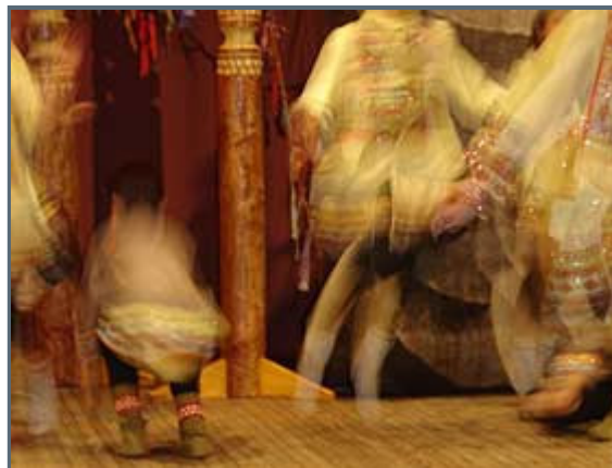
Dancing Yakut spirits

We were lucky to see how they did the traditional Fire Dance and Song. It was accompanied by an odd instrument, which English name I don't know, like a mouth harmonica, with a mysterious sound. It was hard not moving one's legs. In the middle of the dance, the shaman stepped in and began chanting. The witchdoctor which traditionally, and I guess today, is the one which has the ability to communicate with the various spirits. It was a woman dressed in a emerald green dress. "I think you will come out clean on the other side", she said regarding our upcoming trip and without knowing anything about our black flying friends, "as long as you don't harm your relations with the ravens."