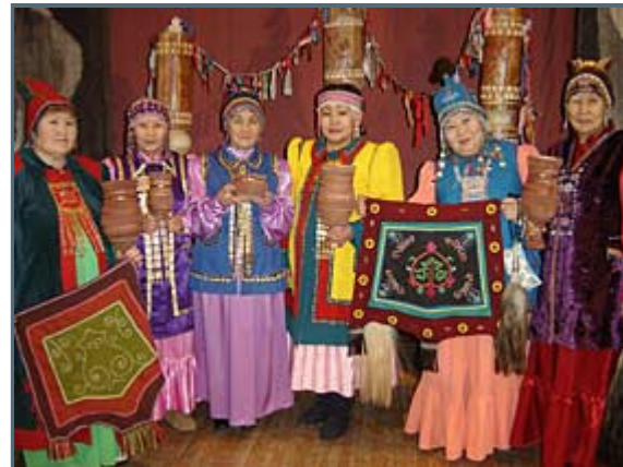
Local people inspire us

At the present, we've been traveling for 6½ months. We've put most of what we hoped to accomplish behind us. As we see it, we have one remaining difficult stretch left. 350 km:s and a months skiing to Kolymaskaya from here. After that, we reckon we have two easier stretches, at least on paper, where we only see polar bears and blizzards as the major obstacles. However, I am worried that we might fail during this upcoming stretch. Not we, but that I will.