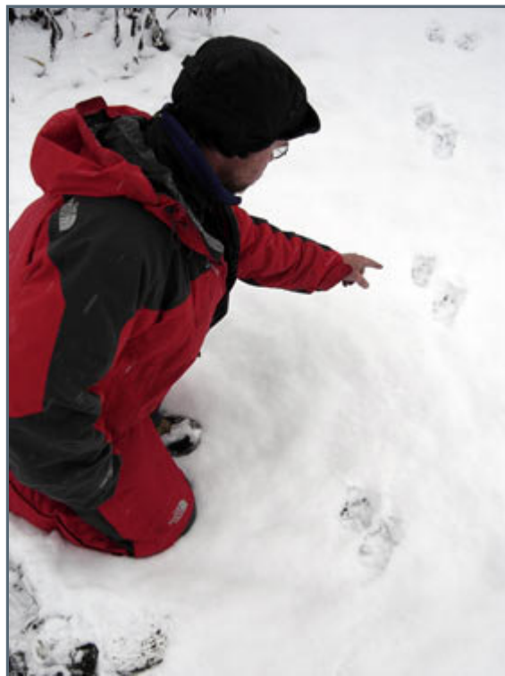
Tracks after the sighted wolf

Just before 6 p.m today, an hour before it starts getting darker, we heard a howling just to the left of us. 50 meters away we saw a magnificent sight. A grayish brown wolf, who slightly amazed starred at us, before he hesitantly trotted off into the dense bush behind him. We paddled as fast as we could up to where we saw him and investigated his movements. We noticed he had been lying down, when he probably had scented us, but not being sure where we were or who we were, he stood up and started to howl to mark territory. When we showed up silently in a canoe, he got silent, he didn't seem worried one bit, it took almost a minute before he hesitantly turned around and disappeared. The size of his tracks weren't too big and the rest of his behavior makes us believe it was a young male.