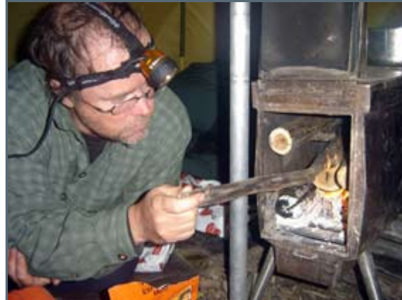
Enjoying the heat

The bothering small flies have left us since two days back. The leaves are covering the ground. We've put on longjohns and a warm balaclava, we're running the woodstove in the cot and it's getting far to cold to clean the fish and the nets every morning. The winter is definitely on its way. There's a constant smell of snow in the air. For this reason, we've put a lot of effort into putting some kilometers behind us today, getting closer to Zyryanka. We're only 160 km;s southeast of the settlement.