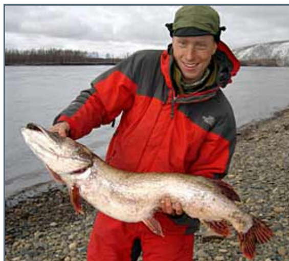
We caught this giant pike on a line behind the canoe. It grabbed a 3 gram Vibrax spinner with a small ball of harefur as extra bait. Weight: We estimate 12-15 kg:s, maybe more.

He said it in a degrading way, for us to understand that yakuts and chukchis didn't have the same human value, as white Caucasian Russians himself. The same way that Muscovites talked about the Siberians and people from Magadan. And the same way people in Magadan described people living along the Kolyma. And the same way white Caucasian Russians living along the Kolyma talked about the native people of the region, the yakut, chukchis and yukahirs. We've met none of them yet. Just seen a couple of them, from a distance, passing us in a speeding motorboat going upstream. They waved and cheered us in a way which made us understand they were not the typically white reserved Russians.