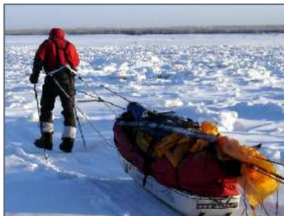
Some parts of the way are tougher than others.

Vi har nu som sagt bara börjat och vi har fortfarande det tuffaste framför oss. Pulkarna känns tyngre och tyngre för varje dag som går och igår snöade det en hel del vilket har gör det än tuffare. Just nu är jag rejält trött och väldigt frusen, och redan nu, efter bara några dagar, har jag börjat undra om jag verkligen kommer att klara det här, för det är fruktansvärt kallt!