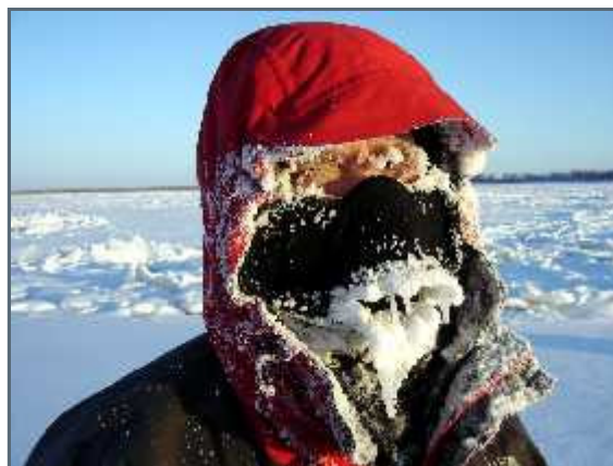
After two hours of skiing

The main problem right now is that there's almost impossible to take a break. It is almost unbearably cold. Almost terrifyingly cold. The only thing one can do is constantly move and hope to avoid as many obstacles as possible. We've been pretty lucky so far. We've navigated to near perfection, even though we cannot follow the shortest way due to big areas of broken up ice which are extremely difficult to pass. We've, so far, had no problems with spotting open water, since it's smoking like the worst fire due to the cold. An inch of snow covers the ice, so it could be much harder. But the cold is harder to handle than I imagined. And worst of all is, it'll just get colder every day from now on until mid-February.