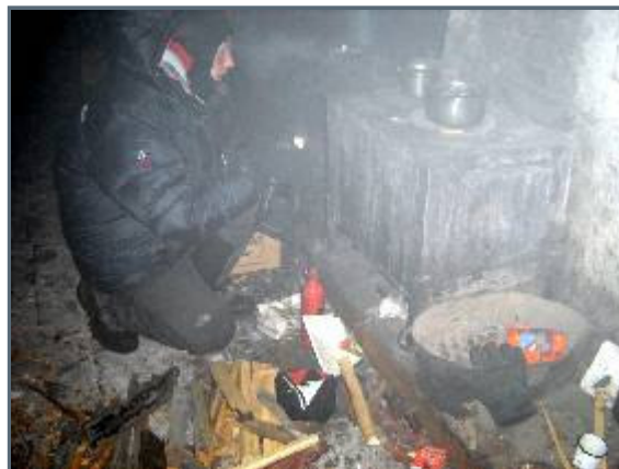
We are trying to heat the log cabin

The time is getting close to midnight. We're both coughing badly, the cold is still there, and we've got headaches, some fever and eyes are sore. This is the second night in a row that we've occupied a temporarily abandoned hunting logcabin, where the heating stove is beyond belief crappy. We've worked like demons, since we arrived here at 2.30 p.m. today, trying to get the heat up. When we started, the indoor temperature was -36°F. Right now, 8 hours later, it's only -29°F! Last night, having put in the same amount of work, even though we fed the stove with firewood every hour, we didn't get the temperature above 12°F. We hardly got any sleep at all. The problem is, except this extreme cold at all, is that these last two, half ruined, logcabins are too big and the ceiling too high. Plus that the stove's been letting through large amounts of smoke all the time. Which is far from healthy, but still a better choice than sleeping in the tent at -49°F temperatures!