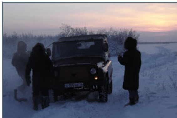
What do you do when your car break in the middle of nowhere?

Behind us, with a shimmering red sky wheezing off in the horizon, we could see a couple of caribou's slowly walking across the big lake that we'd just passed with the Russian Jeep, UAS, right before the suspension gave up on the right wheel. A hundred meters ahead of us the road turned right, disappeared behind an array of bushes and continued it's way into the empty whiteness. The temperature, at the time we left Srednekolymsk was -49°F, but as we'd traveled into this extensive area of lakes and marshes there wasn't much that could stop the wind from making life even colder.