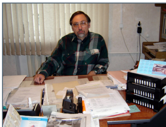
Arkady Maximov world renowned polar scientist at the Arctic Institute in Magadan