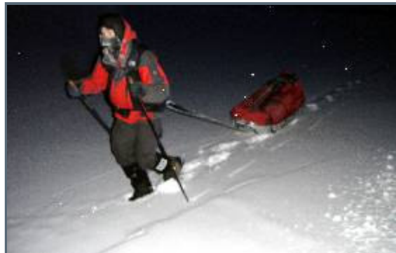
We spend a lot of time pulling in the darkness now, this photo taken at 10 a.m!