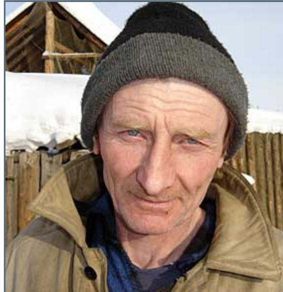
The son of two murdered Gulag prisoners

His answer didn't surprise me. It is pretty much the same I've received from all people who's got similar experiences along the Kolyma. For me, it is impossible to understand this forgiving and understanding way to judge the mad dictator Stalin and the Gulag history. If I take into account all the unfortunate people I've come across all over the world during my 25 years of exploring, people with similar experiences, I believe this particular way to see things is very Russian. Indeed. And