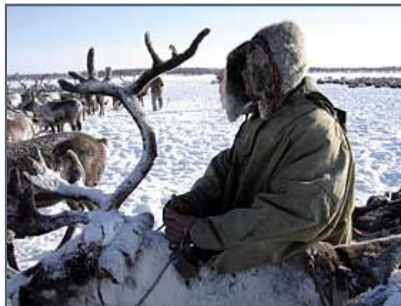
Chukchi, people of the tundra

-13°F today in this little village of Kolymskaya. It is Sunday the 27th of March, Easter Sunday, which obviously isn't celebrated here in this Pagan country. It's grey, foggy and a bit windy. Another concert is arranged in our honour today. I look forward to it and eager to see what will happen. We were also told yesterday that they've arranged a Goodbye party in our honour two days before we leave, enough to give us one day of rest. I do worry a bit what that will turn out to be, since the intoxication of alcoholic beverages is visible in the village.