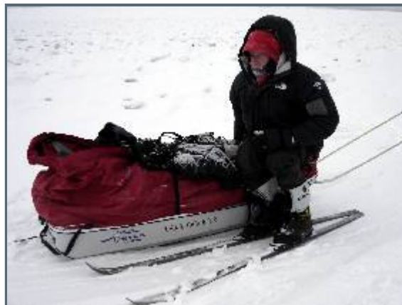
This photo gave me two frost bites

It's been pouring down with snow the last couple of days. Every step forward is a struggle at the present. The only thing to do at the moment, is to focus a meter in front of your feet and work as hard as you can. Since we only have six hours of daylight, we have to ski during two hours in pitch black darkness to be able to do our set 15 km/s a day. Today we've skied 3 hours in the dark to be able to do that. One thing is for sure, we wanna reach Srednekolymsk for a rest before facing -58 and -76°F day in and day out.