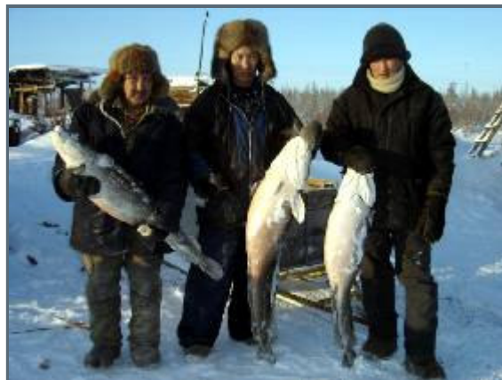
We will miss both food and friends

We've been here for ten, well needed, days now. Finally this stubborn cold seems to have disappeared so that we can move on tomorrow. The cold's left us with a cough which I guess won't disappear until we reach Kolymaskaya.