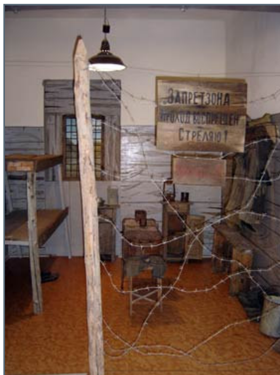
Interior in a typical

3.5 million people froze, worked or were beaten to death in Kolymas camps. One of the most popular ways to murder people was to shove them into a room during the coldest part of winter, it can be down to -80^{\circ}\text{C} here, with a little woodstove in the center. The one closest, the strongest ones, to the stove survived, all the others froze to death.