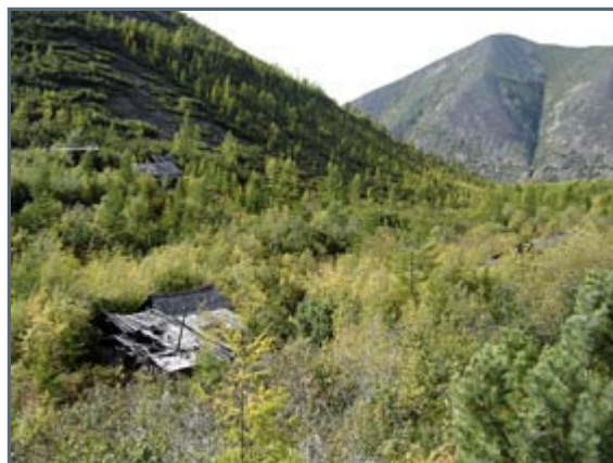
The Kanjon Gulag