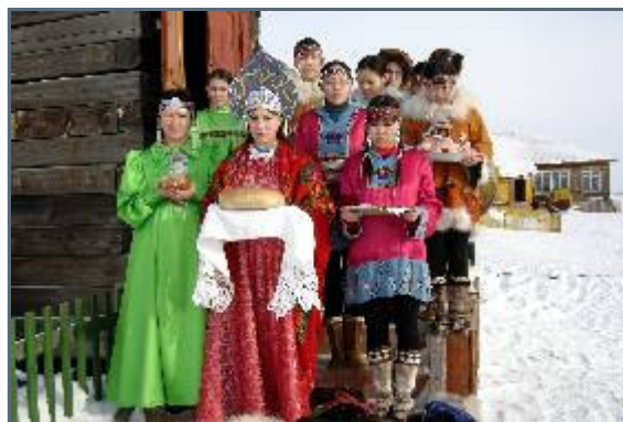
Big welcome in Kolymaskaya

What a welcome indeed! We were immediately, whether we were tired after 6 weeks skiing or not, brought to the local museum, where we were welcomed in a traditional Chukchi fashion with offerings to the Gods during a mellow drumming, than treated to some spiritual dancing and singing, finished off with eating a table with local delicacies like reindeer tongue, bone marrow, straganina, sugared gold berries and , of course, chai.