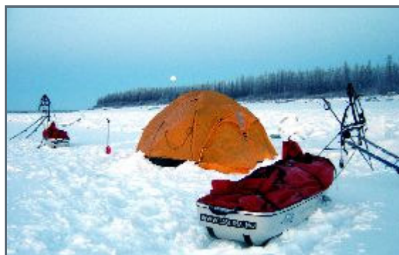
Sleeping in a tent at -45,4 °F

Me and Mikael woke up at 4 am this morning and we could both feel the body aching with pain and tiredness. We then took the decision to stay at this abandoned hut and take a day of well needed rest. N 66°18'52,0 and E 151°46'34,7. Only -31 °F today but snowy and bad visibility, light but cold wind from south.