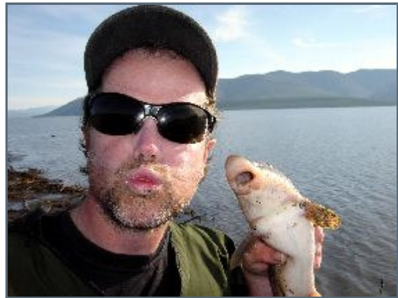
tried to do a Rex Hunt, but I bear to do i to our staple diet

After our first week of terribly bad weather dominated by a river of violent rapids, whitewater and stressed nerves, this second week offers us a blazing hot sun, slight tailwinds, an ocean of calm water where paddling is demanding, but easy so to give us plenty of time to either contemplate life or enjoy the magnificent surroundings. Another change of fortune this week, is the fishing. We didn't even get a sign of life the first week, now we get sufficient fish everyday to keep us strong and healthy without us using our backup food consisting of Norwegian dried/frozen food. Today we netted our first pike of the trip, which we filleted, grilled and ate for lunch together with a grayling.