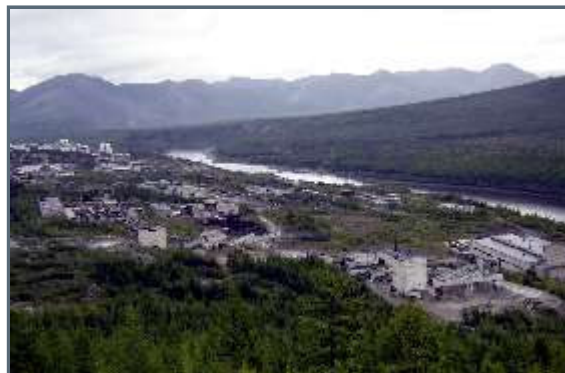
Write description img 2