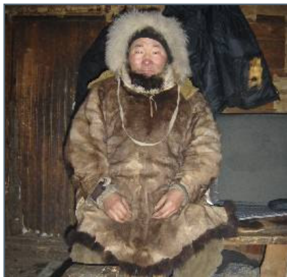
One of our visitors!

The first days of traveling north again have been rough for me. The cold, which I had before we left, caught up with me again and when we camped the first night I had a fever and I was coughing badly. The second day started in the same way, I threw up and the first hours of the day was like a nightmare, but as the sun rose, I started feeling better. Now, two days later, I'm feeling a lot better.