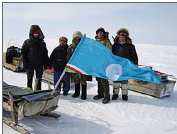
Being picked up at Ambarchik Bay

I just experience emptiness right now. I feel run down, slightly miserable and somewhat somber. I feel totally drained of all my energy. After having spent almost 10 months, fully concentrated, suddenly it is all over. Just like that. I know from experience, this mood will stay until I once again meet my loved ones. And, I cannot forget how stunningly beautiful Ambarchik was!