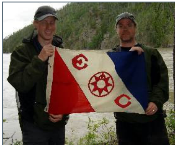
Explorers club at the source of the Kolyma river

After lunch, we repair sandals, the equipment gets checked, we eventually start a new fire, we grill another two graylings from the morning, salty and nice, and have them as dinner together with pasta. Imagine if we hadn't caught any fish, then we would have been forced to eat a muddy looking soup with rice. Suddenly it is sunset, the swarms of mosquitoes appear again and makes life miserable again. We flee to the cot and at the same time as Johan notices a movement in the net, breakfast is ready and once we're protected from the mosquitoes we both agree that we live life to the full capacity! Another stressful day in the canoe awaits us tomorrow.