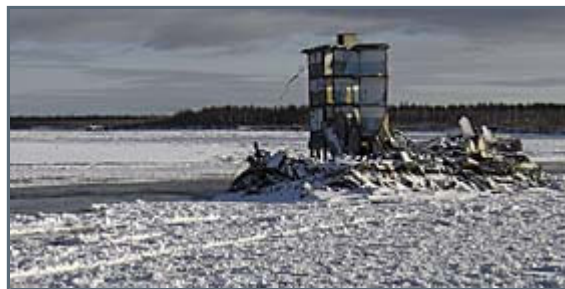
This is how Kolyma looks like right now. The school of Zyryanka can be seen in the middle, collapsed earlier this year by the strong currents of the river.

The only certain thing we know about the winter right now, is the fact that it will be extremely cold! And to be able to survive during the coldest periods we have to plan meticulously, be smart, think ahead and calculate the obstacles waiting, and if we do that, than nothing can go wrong!