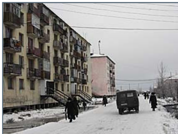
The main Street in Zyryanka, Lenin Street