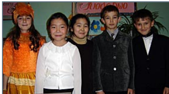
Zyryanka's population is half Caucasian Russian and half yakut/yukahir