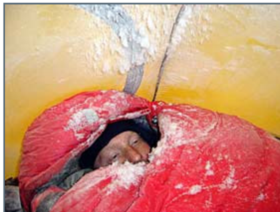
Meeting those Scandinavians was as cold as sleeping in a tent below -40°

We were supposed to fly out from Chersky today. But no plane arrived. Spring has arrived, though, with really warm weather, the economy at the local airport has crashed and nobody seems to want to clear the runway. Right now it is impossible to land a plane here. This is a minor catastrophe for us. We might miss every single press conference and TV-appearance that has been lined up for us. All of this which would have given us a great chance to promote the great virtues of this region. It is Tuesday the 26th and if we're really unlucky, we might still be here when summer arrives.