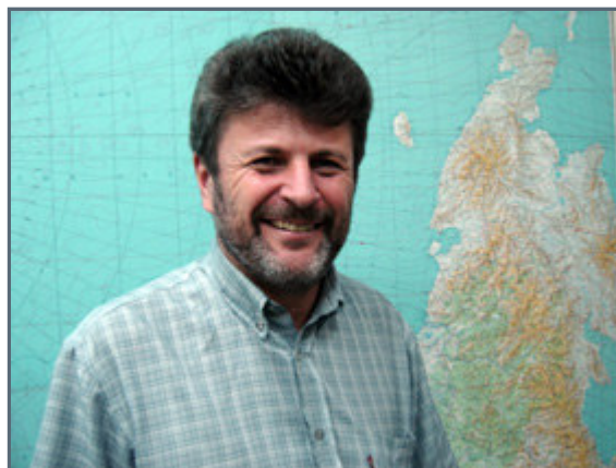
Well-known Russian explorer