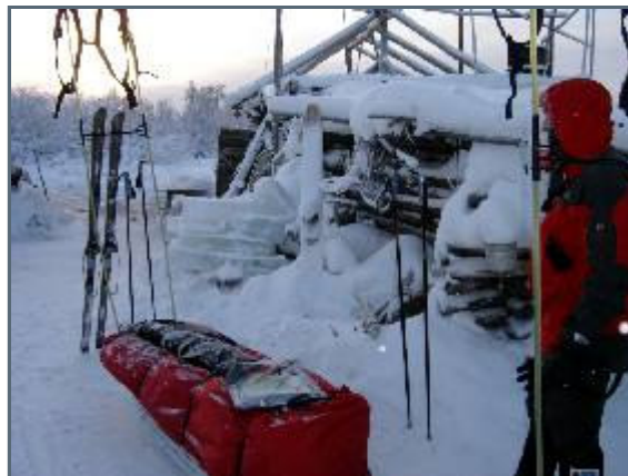
Arrival at hunters camp

Johan's binding broke today again. Same problem as before. Such is life. Life goes on. At least since we have spares with us. This problem have made us change route slightly and we've skid to a hunters camp, since we need to get indoors for the glue to stick. We've tried to avoid people since we left Srednekolym'sk, since it seems they've all been hit with a nasty flu. Which is the worst a couple of hypochondriacs like us can hear about! We rather suffer -46°F sleeping in the tent than getting close to this evil thing! And, of course, all these trappers were badly hit by the flu. Not good at all!