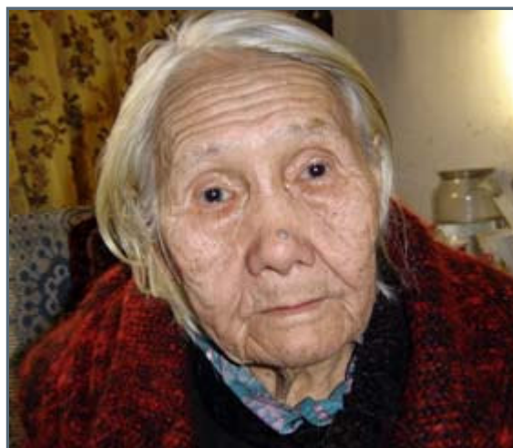
91 year old yugahir lady which is full of wisdom

After that, they've been with us almost all the time. They're the one's which alarmed us when this giant of bear attacked us, they've also indicated by their presence the best campsites we've had and the best places to place our nets. And, believe it or not, yesterday, even if it