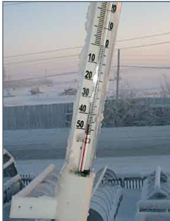
Temperature at noon today