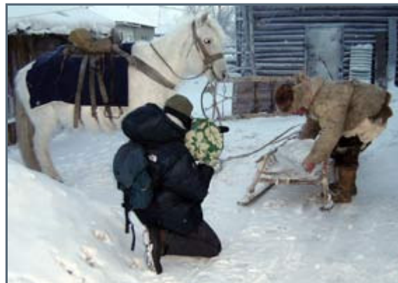
Filming in -58°F or below