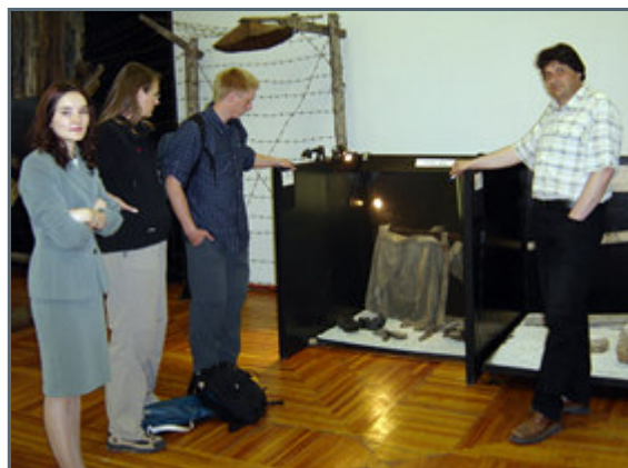
Guided tour at the Magadan museum