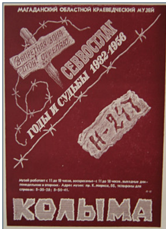
Sign at the museum about the Kolyma gulags

Idag gjorde vi ett intressant besök på ett museum här i Magadan. Väldigt intressant angående de ökända gulagerna och alla dess hemskheter i Magadan och Kolyma regionen. Även utställningar som visade hur dagens Magadan ser ut, vad