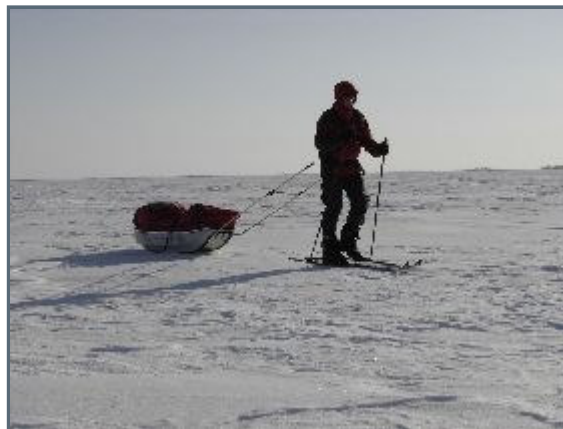
Leaving the taiga for the tundra

It's been two fast and easy days on the hard sastrugi. The taiga is giving way to the empty, vast, flat and horizon free tundra. We've spotted several watch towers and high fences on the banks in the east, to remind us of the sad history of the Gulags. The paradox, however, is that even though one of the worst crimes in the history of mankind have been committed here along the Kolyma, this is where I've come across the nicest and truest human beings during all my travels. Only a mere 50 years later!